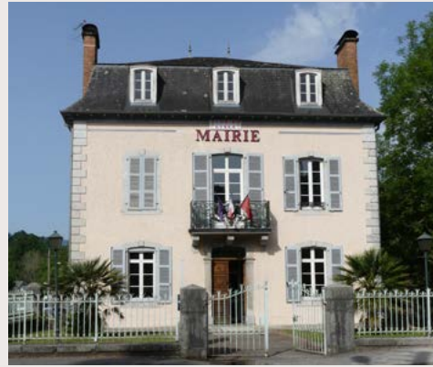
Mairie de Tardets-Sorholus (64)

Les séances du Conseil municipal sont publiques. Les délibérations sont consultables à la mairie ou en ligne. En tant qu'organe exécutif, le maire prépare et exécute les délibérations du Conseil municipal.