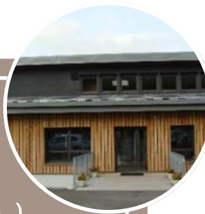
Siège social de la communauté de communes des portes du Haut-Doubs (25)

Des communes peuvent créer des regroupements intercommunaux (syndicats de communes, communautés de communes ou d'agglomération...) en transférant certaines de leurs compétences. Dans ces regroupements, chaque commune membre est représentée par un ou plusieurs conseillers municipaux.